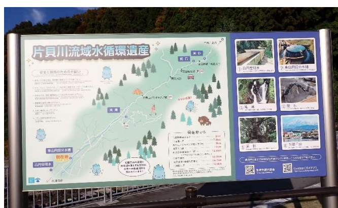
片貝川・東山円筒分水槽